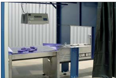
Prüfkabine mit UV-Leuchte

Im Einlauf werden die Werkstückaufnahmen über Sensoren abgefragt. Je nach Bauteil-Geometrie werden die Werkstücke stehend oder liegend geprüft. Schöpfende Bereiche, in denen sich Prüfmittel ansammeln könnten, müssen vermieden werden, um deutliche Rissanzeigen auf der gesamten Bauteiloberfläche zu erhalten. Die Kette ist mit schnell wechselbaren Werkstückaufnahmen ausgestattet, um verschiedene Bauteilgeometrien transportieren zu können. Auch Lösungen mit motorisch verstellbaren Kontakten zur automatischen Längen Anpassung sind realisierbar. Wenn die Bauteillänge es zulässt, kann der Durchsatz über Mittenkontakte erhöht werden. Die Gesamtlänge beider Bauteile darf dabei 600 mm nicht übersteigen. Auch der Einsatz mehrerer Magnetisierstationen hintereinander ist realisierbar, um bis zu acht Bauteile pro Takt zu prüfen. Bei hohen Taktraten bietet sich ein Rundtisch an, der eine taktungebundene Auswertung erlaubt.