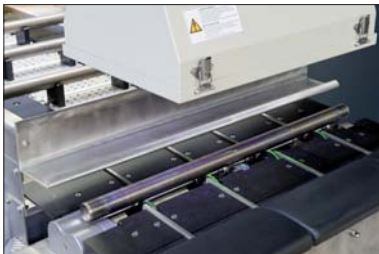
Drehrollenstation für Stangenabschnitte