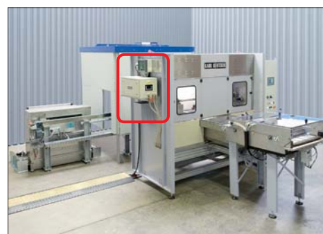
Prüfmaschine mit angebautem FLUXA-CONTROL (Automatische Prüfmittelüberwachung)