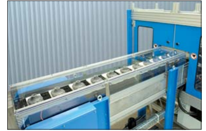
Einlaufband mit 11 Werkstückaufnahmen

Der Ein- und Auslauf der DEUTROMATEN wird projektspezifisch konzipiert. Faktoren wie z.B. Bauteilgewicht, -geometrie und der optimale Transport der Bauteile fließen in die Konstruktion ein. Da im Einlauf bewegte Teile verbaut sind, kommt dem Arbeitsschutz eine hohe Bedeutung zu. Lichtschranken, eine optimale SPS-Programmierung und die Bedienung über Touchpanel sorgen für einen reibungslosen Prüfablauf.