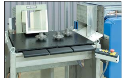
Sortierung und Entmagnetisierung