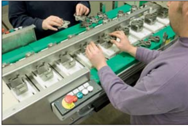
Einlegen der Bauteile und visuelle Kontrolle

Der Ein- und Auslauf der DEUTROMATEN wird projektspezifisch konzipiert. Faktoren wie z.B. Bauteilgewicht, -geometrie und der optimale Transport der Bauteile fließen in die Konstruktion ein. Da im Einlauf bewegte Teile verbaut sind, kommt dem Arbeitsschutz eine hohe Bedeutung zu. Lichtschranken, eine optimale SPS-Programmierung und die Bedienung über Touchpanel sorgen für einen reibungslosen Prüfablauf.