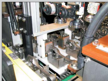
Prüfung von vier Pleueln pro Prüftakt (2 Mittenkontakte, 4 Joche)