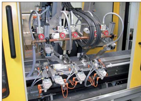
Prüfung von Radnaben (stehend)

Zahlreiche Kunden vertrauen inzwischen diesem Prüfkonzept. Entsprechend hoch ist die Vielfalt der zu prüfenden Teile. Im Weiteren werden Beispiele für dieses erfolgreiche Maschinenkonzept gezeigt: