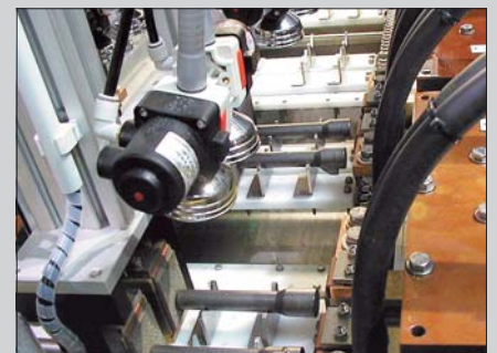
Prüfung von acht Bauteilen pro Takt (4 Mittenkontakte, 8 Joche)