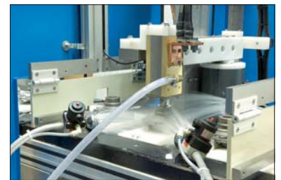
Dorn-Magnetisierung und Bepülung

Im Einlauf werden die Werkstückaufnahmen über Sensoren abgefragt. Je nach Bauteil-Geometrie werden die Werkstücke stehend oder liegend geprüft. Schöpfende Bereiche, in denen sich Prüfmittel ansammeln könnten, müssen vermieden werden, um deutliche Rissanzeigen auf der gesamten Bauteiloberfläche zu erhalten. Die Kette ist mit schnell wechselbaren Werkstückaufnahmen ausgestattet, um verschiedene Bauteilgeometrien transportieren zu können. Auch Lösungen mit motorisch verstellbaren Kontakten zur automatischen Längen Anpassung sind realisierbar. Wenn die Bauteillänge es zulässt, kann der Durchsatz über Mittenkontakte erhöht werden. Die Gesamtlänge beider Bauteile darf dabei 600 mm nicht übersteigen. Auch der Einsatz mehrerer Magnetisierstationen hintereinander ist realisierbar, um bis zu acht Bauteile pro Takt zu prüfen. Bei hohen Taktraten bietet sich ein Rundtisch an, der eine taktungebundene Auswertung erlaubt.