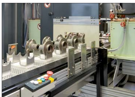
Prüfung von Radnaben (liegend)