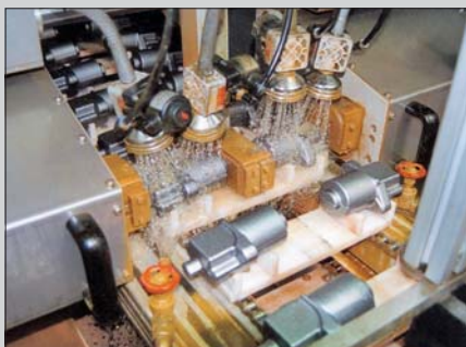
Prüfung zweier Pumpengehäuse (Einsatz eines Mittenkontakts)