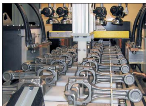
Prüfung von Pleueln