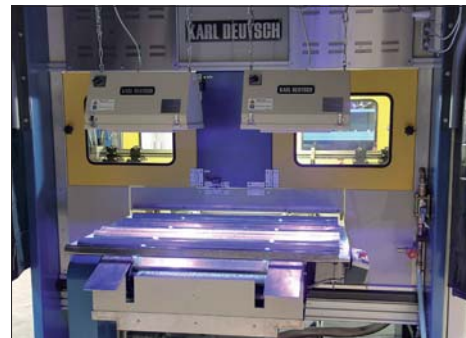
Prüfung von Stabilisatoren