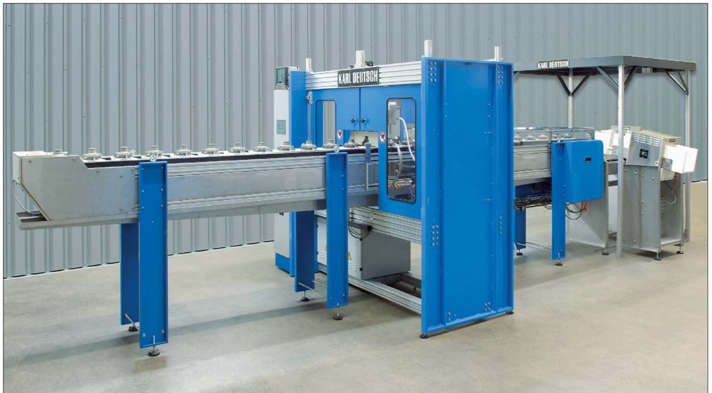
DEUTROMAT Kettentransport für Radnaben: Der Einlauf (links) verfügt über 11 Werkstückaufnahmen. Die Radnaben werden stehend transportiert. Die gekapselte Prüfstation (Mitte) verfügt über eine vertikale Magnetisierstation. Der Auslauf (rechts) endet in einer Prüfkabine (hier noch ohne Vorhänge), in der sich ein Prüftisch befindet. Die Entmagnetisierung erfolgt in diesem Fall nach der Auswertung. Durch die am Prüftisch geneigt montierten Spulen rutschen die Bauteile in Sammelbehälter.

Um einen besonders hohen Durchsatz zu realisieren, werden Prüfmaschinen mit einem automatisierten Bauteiltransport eingesetzt. In der Regel werden zwei bis vier Bauteile pro Takt geprüft. Typische Taktraten sind 12 Sekunden. Aus Spritz- und Arbeitsschutzgründen wird die Prüfstation gekapselt. Für den Servicefall sind alle relevanten Teile über Schwingtüren gut zugänglich. Der Einlauf erlaubt eine frei zugängliche Beladung, die unabhängig vom Prüftakt erfolgt. Die Beladung erfolgt entweder manuell in Kombination mit einer Sichtprüfung, automatisiert über ein Portal oder durch einen Industrieroboter. Zur Betrachtung und Sortierung der Bauteile befindet sich im Auslauf meist eine Prüfkabine mit einem Prüftisch. Eine Entladung per Roboter ist ebenso möglich.